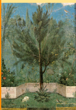
Affreschi di Villa Livia

La forma più diffusa del giardino romano era quella dello "passaggio coperto" collocato di solito nel peristilio, nelle terme della palestra o nei