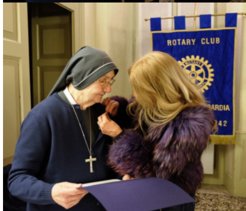
Suor Pierangela con il nostro Presidente e con la Vice Presidente