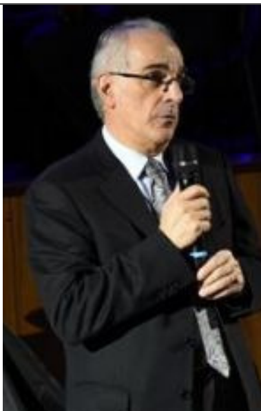
Il Governatore Gilberto Donde'

P er celebrare il 111° anno di fondazione del Rotary, ben otto Club Rotary del Distretto 2042