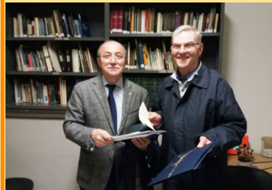
Il Presidente dell'Associazione Astrofili Soresinesi Ghisleri