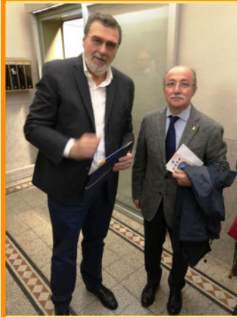
Il Presidente del Museo della Bicicletta Azzini