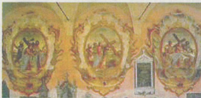
Una Via Crucis sulle pareti del vecchio cimitero di Romano

Ben 240 anni fa, molto prima dell'editto di Napoleone Bonaparte, che ordinava la sepoltura dei morti fuori dai centri abitati, venne costruito fuori dal borgo il cimitero della «Gamba». Grazie alla ricostruzione