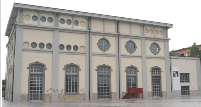
L'ex Centrale Elettrica di Via Daste e Spalenga a Bergamo

L'appuntamento è a Bergamo per un altro fuori porta dell'RC Romano di Lombardia in questo anno rotariano, l'occasione è l'evento allestito da Contemporary locus, associazione