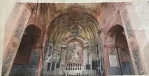
Una cappella del Cimitero della Gamba: anche qui sono visibili lapidi sulle pareti