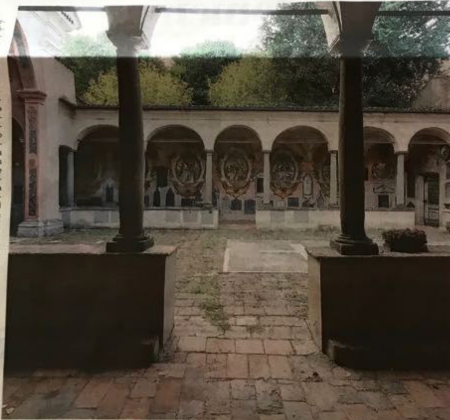
Il Cimitero della Gamba a Romano: lungo la parete dei portici una Via Crucis affrescata sotto la quale spiccano le lapidi.

politura di due «comizi» antichissimi e veramente esemplari per amor di religione». «Una particolarità di queste iscrizioni è che nessuna riporta sia la data di nascita che di morte del defunto, ma solo una delle due date insieme all'età al momento della morte», commenta Silvia Carminati, architetto che qualche anno fa ha curato la trascrizione di tutte le lapidi.