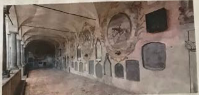
Uno scorcio del portico del Cimitero «vecchio» di Romano