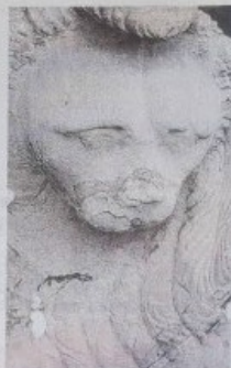
Il leone alato del municipio

governo della Serenissima in questo terra al confine dei suoi possedimenti di terraferma, con la concessione di esenzioni e di privilegi fiscali agli abitanti. Ma è quello posto sul palazzo consiliare a produrre il maggiore impatto visivo. L'edificio era la sede del podestà-provveditore che la Repubblica di Venezia inviò a Romano per gli oltre tre secoli